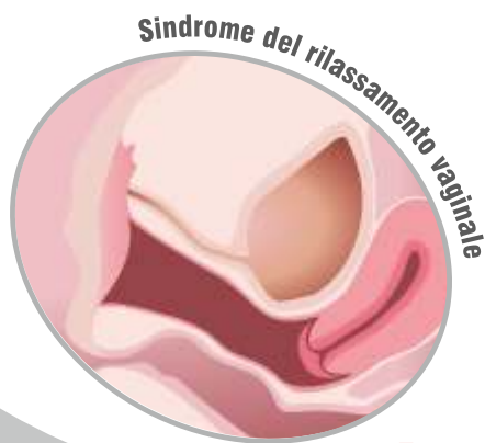
Sindrome del rilassamento vaginale