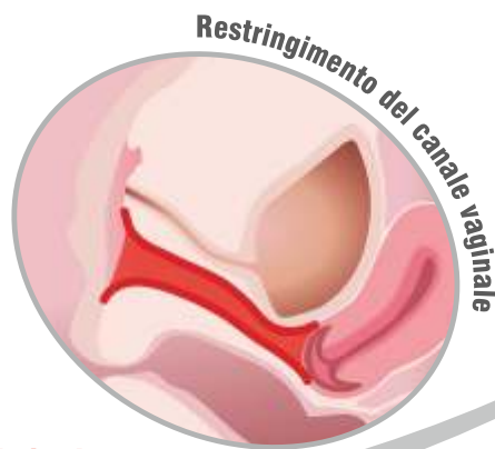
Restringimento del canale vaginale